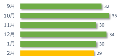
医療事故報告件数の推移（直近 6 か月）

2 月は事故発生の報告が 29 件ありました。 病院・診療所別では、病院からの報告が 26 件、診療所からの報告が 3 件でした。 診療科別の主な内訳は、外科が 6 件、整形外科が 5 件、心臓血管外科が 3 件でした。