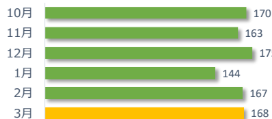
相談件数の推移（直近 6 か月）

遺族等の求めに応じて相談内容をセンターが医療機関へ伝達したものは 1 件でした。（累計 18 件）