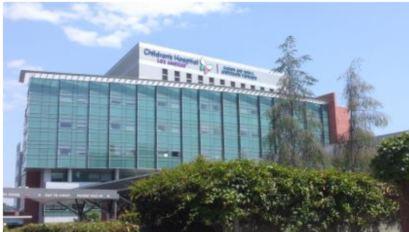
図1. Children's Hospital Los Angeles の外観