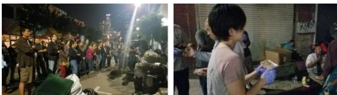
図4. ダウンタウン,ホームレス街での食事提供ボランティア.

以上のように医師としての歩みを振り返ってみると、我ながら色々なことをかなり遅い時期から始める結果となっているようです。留学にしても若いころに行っておけば、その後より長くその経験を生かせるというメリットはあったでしょう。しかし遅いからこそある程度の経験と知識を積んでいるので、 observer の立場であっても十分理解でき、より得られるものが増えた、という面もあるかと思っています。また、ほぼ全ての時間を同じ業界の方々と過ごしている日本の生活とは異なり、病院外で活動に費やす時間が取りやすかったため、ボランティア、 ESL のサークルなどを通して実際の「アメリカ社会」に触れることもできました。特にホームレス街での食事提供ボランティアでは人間が「生きる」ということの根源を、病院内とは違った観点から考えさせられました(図4)。今回の留学は、医学の面だけではなく、他では得難い計り知れない大きさの経験をもたらしてくれたと思います。推薦くださいました小児循環器学会学術委員会の先生方に深謝いたします。また米国留学の期間を通じ、これまでご指導ご支援いただきました先生方に感謝申し上げます。