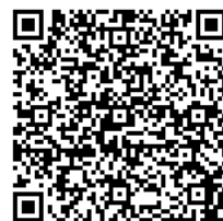
参加申し込み用 QRコード